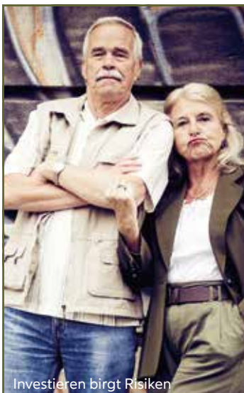
Investieren birgt Risiken