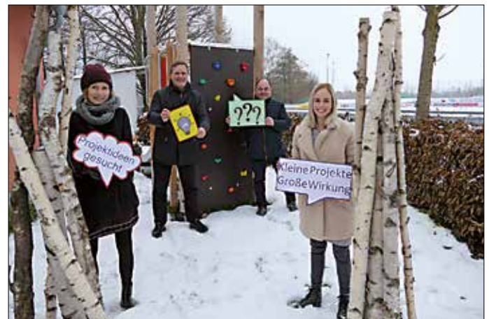
Der neue Spielplatz für die Sportgaststätte des TSV 1894 Langenzenn e.V. wurde 2020 mit fast 8.000 Euro unterstützt. Ab jetzt können Projekte für die Förderrunde 2021 eingereicht werden.