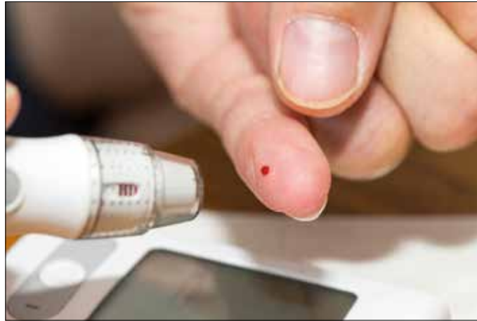
Blutzuckerwerte im Griff: Der neue Online-Coach Diabetes motiviert zu einem gesünderen Lebensstil und liefert dazu viele praktische Tipps, Beratung per Telefon, E-Mail und Online