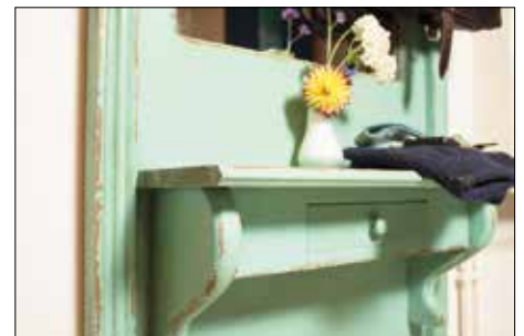
Es muss nicht immer Hochglanz sein. Der Shabby-Look steht für Einrichtungsgegenstände mit Geschichte.

Tempera-Kreidefarben können auf alle unbehandelten Holzoberflächen aufgetragen werden und verleihen dem Interieur den angesagten Shabby Chic. Dazu wird nach der dunklen Grundierung ein zweiter Anstrich in Weiß oder zarten Pastelltönen aufgebracht. Anschließend wird dieser stellenweise wieder ab-