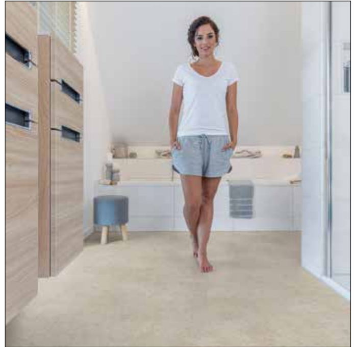
Angenehmer Start in den Tag: Purline Bioboden sorgt auch ohne Fußbodenheizung für warme Füße im Bad.

Auch optisch lässt der Bioboden keine Wünsche offen. Es gibt ihn in verschiedenen Formaten und Dekoren, von der edlen Natursteinoptik bis hin zum authentischen Holz-Look mit feiner Maserung ist für jeden Geschmack, jeden Einrichtungsstil und jeden Farbenwunsch die passende Lösung dabei. Zur Verlegung gibt es zwei Möglichkeiten: Kleben oder Klicken. Die Klickvariante empfiehlt sich besonders bei der Badrenovierung, denn damit lässt sich der Belag einfach, schnell und ohne viel Schmutz auf den Boden bringen – auch auf eine Fußbodenheizung. Und sollte er irgendwann einmal ausgedient haben, kann er rückstandslos wieder entfernt werden. Weitere Informationen unter www.wineo.de .