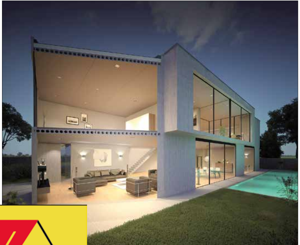
Das Heizen und Kühlen erfolgt über Raumklimadecken. Dazu gibt es multifunktionale Systeme für Massivbau und Trockenbau.

Batteriespeicher sind bekanntlich sehr teuer und haben eine begrenzte Lebensdauer. Dazu gibt es eine hoch-