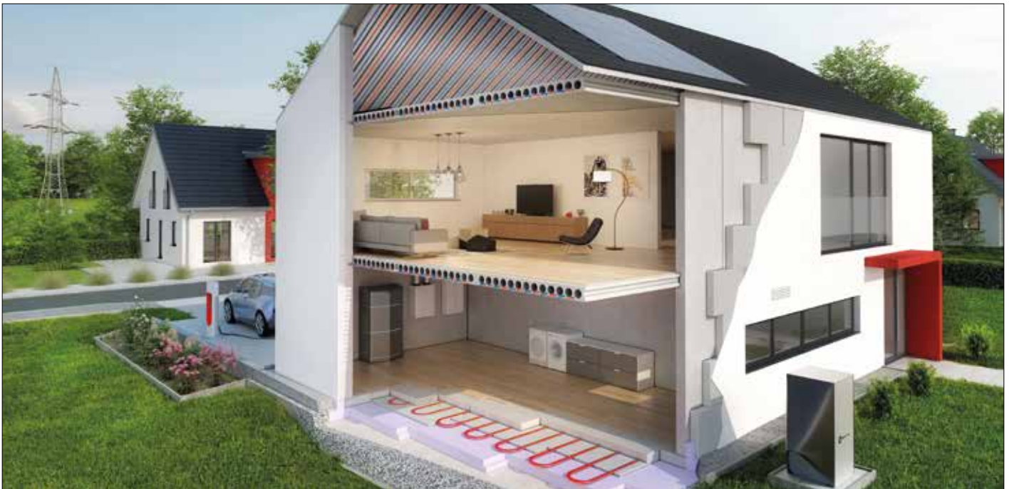
Die Kombination von oberflächennahen, schnell reagierenden Klimadecken und Bauteilaktivierungen ist eine hocheffiziente Möglichkeit zur Speicherung regenerativer Überschussenergie.