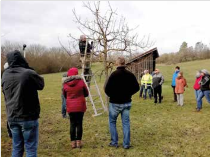
Baumschnitttag auf der Streuobstwiese