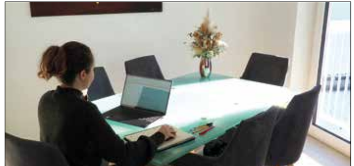
Immer mehr Wohnzimmer werden zum Homeoffice. Besonders Sonneneinstrahlung macht bei der Bildschirmarbeit Probleme.

me. Denn schon bei normalen Wetterbedingungen ist das Außenlicht bis zu dreizehnmal stärker als das Licht des Monitors.