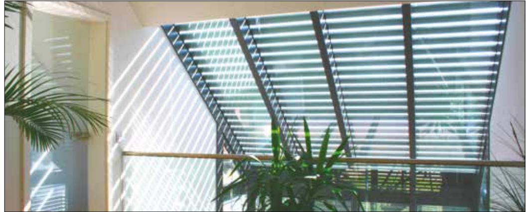
Wichtig vor allem bei großen Glasflächen: Mit Alurolläden bleiben auch zur Sonnenseite ausgerichtete Arbeitsräume stets moderat temperiert.

Alurolläden sind nicht zwangsläufig silbrig. Sie lassen sich farblich beschichten und sind in der kompletten gängigen Farbpalette erhältlich.