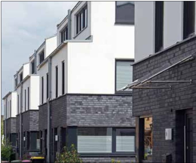
Auf Steinwolle-WDVS lassen sich nahezu alle Oberflächen gestalten. Das verleiht jedem Haus eine persönliche Note. Hier gefitzter Oberputz mit Klinkerriemchen.

sis von grünem Wasserstoff und recyceltem CO 2 , sogenannten E-Fuels.“ Alle eingesetzten Mischungen entsprechen der aktuellen Heizölnorm und sind von den teilnehmenden Herstellern für den Einsatz freigegeben.