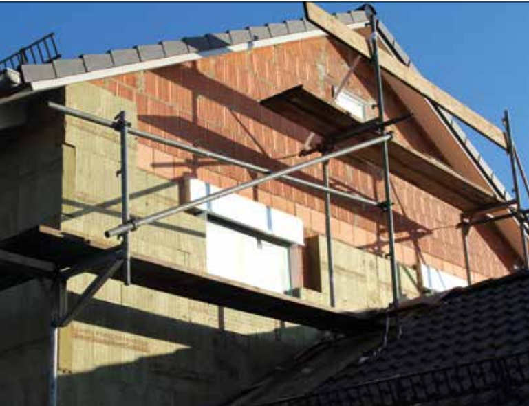
Ein gut gedämmtes Haus spart Heizkosten und schont das Klima. Steinwolle kommt dabei immer öfter zum Einsatz. Bildquelle: „Deutsche Rockwool / Heck“

Auch Gebäude mit einer modernen Ölheizung können die Klimaziele von 2050 erreichen. Dazu trägt zukünftig ein innovativer Brennstoff bei. Dieser wird zunehmend aus erneuerbaren Komponenten bestehen, die herkömmliches Heizöl nach und nach ersetzen. Eigentümer, die eine neue Öl-Brennwertheizung einbauen, können sich schon jetzt an dem Pilotprojekt „future:fuels@work“ beteiligen und treibhausgasreduziertes Heizöl tanken. Haushalte, die ihre CO 2 -Bilanz im Rahmen einer energetischen Sanierung des Hauses besonders deutlich senken können, haben zudem Chancen auf finanzielle Zuschüsse in Höhe von 5.000 Euro.