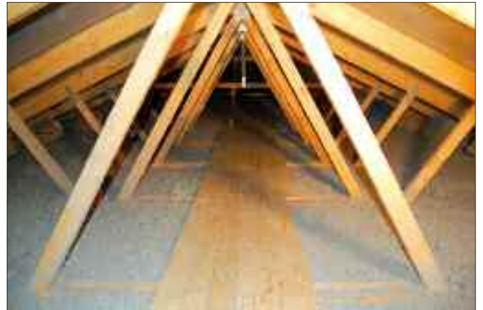
Die Cellulosedämmung verlangsamt das Vordringen der Hitze in die Räume unterm Dach stark.

(pr-jaeger) Mitunter klettern die Temperaturen schon auf über 30 Grad Celsius, wenn der Sommer offiziell nach gar nicht begonnen hat. Da kann sich freuen, wer den Hitze- beziehungsweise Kälteschutz beizeiten optimiert