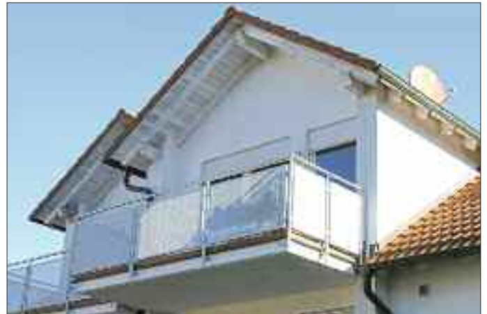
Ein Balkon steigert die Wohnqualität und den Wert der Immobilie.

(pr-jaeger) Es gibt wohl kaum jemanden, der auf einen Balkon verzichten möchte. Kurz einmal frische Luft schnappen, ohne vor