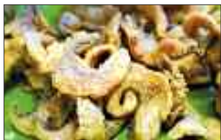
Karpfenchips frisch aus der Pfanne