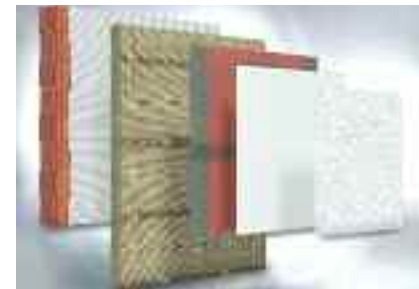
Alle eingesetzten Komponenten, vom Kleber bis zum Oberputz, entsprechen den höchsten Brandschutzanforderungen

(pr-jaeger) Mit der Entwicklung des ersten Wärmedämm-Verbundsystems (WDVS) der höchsten Brandschutzklasse A1 ist nun ein Durchbruch im vorbeugenden Brandschutz gelungen.