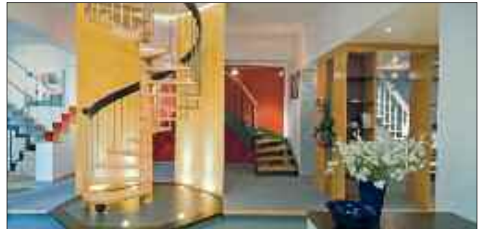
Im Treppenstudio stehen verschiedene Modelle in unterschiedlichen Grundrissvarianten zum Probegehen bereit.