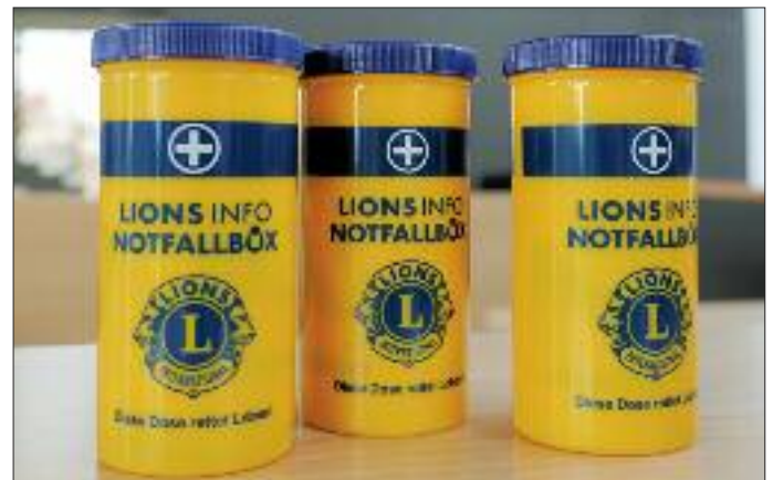
Klein, gelb und retten Leben: Die kostenlosen Notfallboxen aus dem Landkreis Fürth