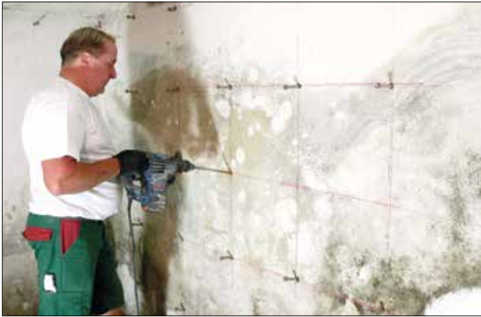
Die Ursache für die aufsteigende Feuchtigkeit lag im Keller - typisch für ein Haus dieser Zeit und Bauart.

warmgewalzter Baustahl gemäß EN 10025 als auch als nichtrostender Stahl gemäß EN 10088. Vor allem im Fenster-, Fassaden- und gelegentlich auch im Geländerbau ist die Verarbeitung von Aluminium gemäß DIN 17611 von Bedeutung. Der Verbund mit Kunststoffen und