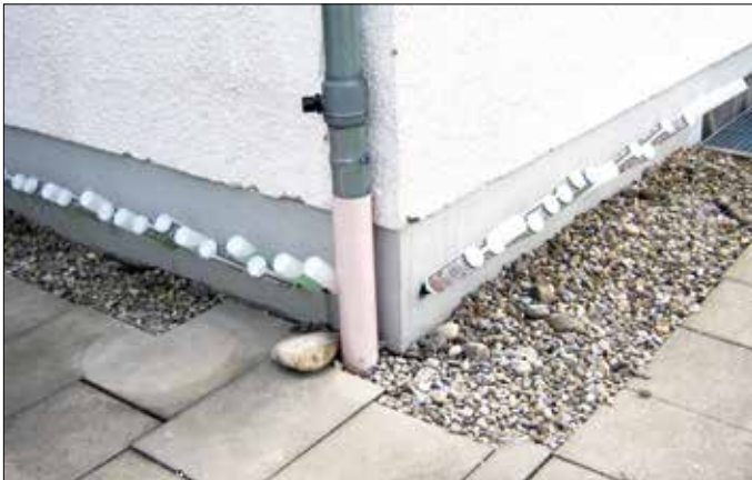
Das schicke Siedlungshaus hatte ein massives Feuchtigkeitsproblem. Eine aufwendige und teure Sanierung drohte.