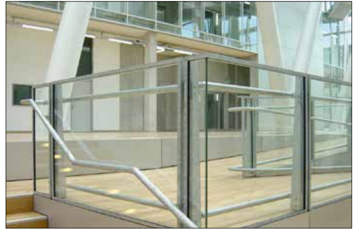
Geländer aus feuerverzinktem Stahl und Glas.

Zu den dem Metallbau zugeordneten Konstruktionen zählen unter anderem die Herstellung und Montage von Fenstern, Türen, Metallfassaden und -be-