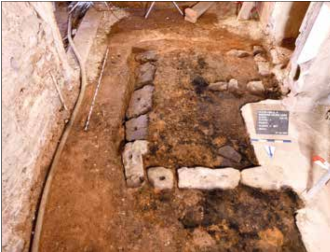
Diele des Gasthofs, Fundamente von spätmittelalterlichen Hofgebäuden