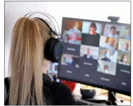
Zum ersten Mal findet JobChecker online in digitalen 1 zu 1 Gesprächen statt.