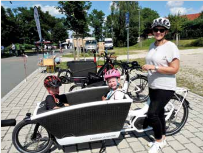
Mutter mit zwei Kindern