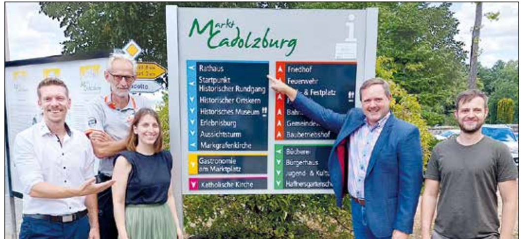
Steigende Anzahl an Besuchern erhöht die Anforderungen an das bisherige Orientierungssystem und dessen Beschilderung im Markt Cadolzburg. Firmen, touristische Sehenswürdigkeiten sowie städtische Einrichtungen wie Schulen, Kitas u.v.m. werden fortan schematisch ausgewiesen und übersichtlich ausgeschildert.

Auf der Suche nach einem Planungsunternehmen zur Konzeptionserstellung wurde folgend