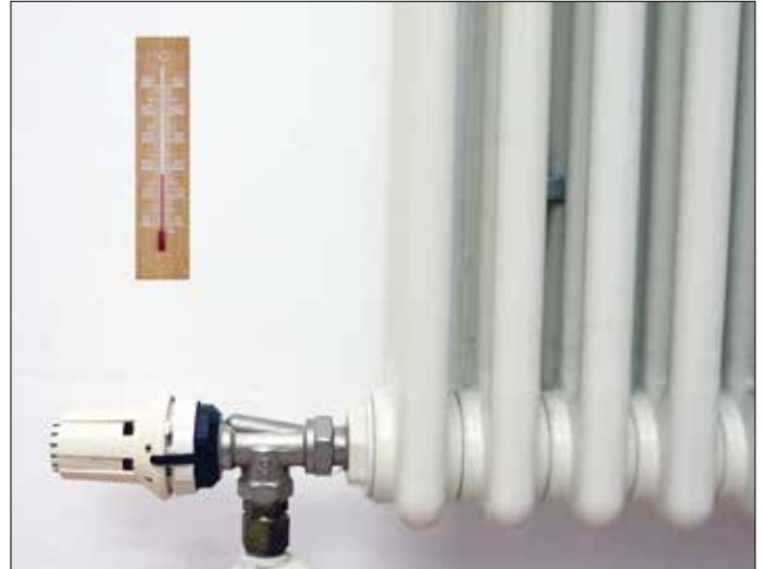
Kalte Raumluft speichert weniger Luftfeuchtigkeit und kondensiert schneller. Naturkalk an der Wand kann in hohem Maße Feuchtigkeit aufnehmen und wieder abgeben.

Der Vorgang, dass sich die Luftfeuchte im Raum an kalten Oberflächen niederschlägt, ist jeden Morgen am Spiegel im Bad zu beobachten. Das Gleiche kann aber auch an kalten Wän-