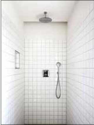
Auch für Küchen und Bäder, die zum großen Teil gefliest und damit nicht diffusionsoffen sind, empfehlen sich für die restlichen Wandflächen diffusionsoffene Kalkputze.

Bei abgesenkter Innentemperatur schlägt sich die Feuchtigkeit im Raum schneller nieder / Kalkputz minimiert Risiko von Schimmel und Stockflecken