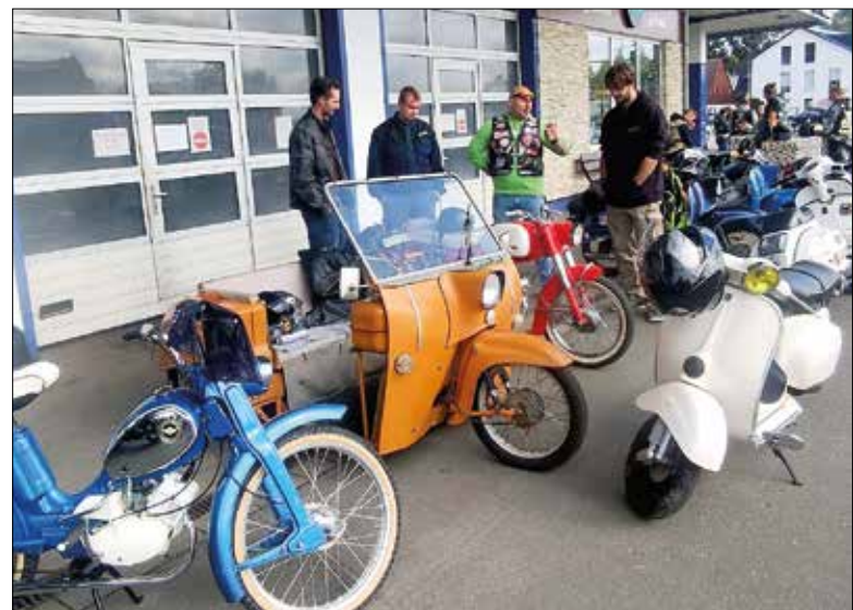
Zweites Fahrzeug von links: Das dreirädrige Krankenfahrrad Simson DUO aus dem Jahr 1984.

Darunter befanden sich auch mehrere Gefährte mit Kultstatus. Wie zum Beispiel das