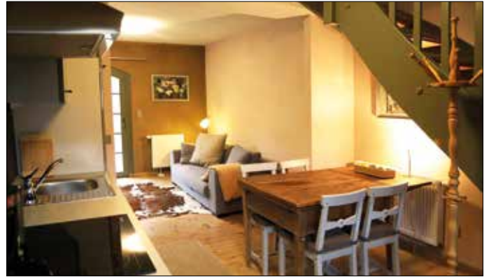
Die innen gedämmten Außenwände strahlen keine Kälte mehr in die Wohnung. Die ökologischen, kapillaraktiven Holzfasern regulieren die Luftfeuchte im Raum.