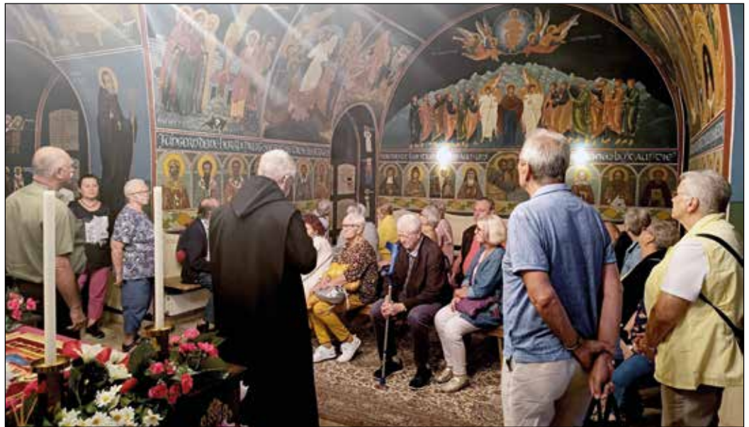
Die stattlich ausgemalte Krypta beeindruckte alle Besucher

Nach einer Stärkung in der Klosterschenke führen die VdK'ler weiter zum Hauptort Berching, das von den Einheimischen das „Rothenburg der Oberpfalz“ genannt wird. Die Stadtführerin brachte die historische Entwicklung der Stadt der Besuchergruppe näher sowie auch die Höhepunkte im Jah-