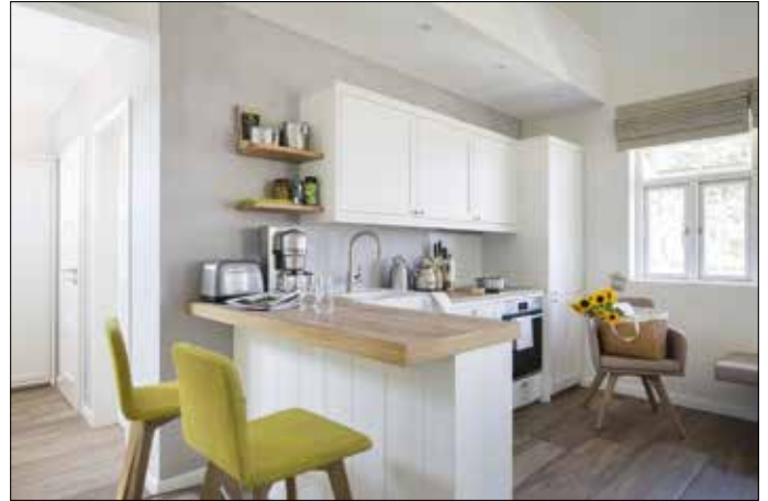
Bei abgesenkter Innentemperatur schlägt sich die Feuchtigkeit im Raum schneller nieder. Ein diffusionsoffener Wandputz kann Feuchtigkeit aufnehmen, speichern und wieder abgeben.

Hochwertiger Naturkalk – ob als Kalkputz oder in Form von Kalkanstrichen – ist nach Einschätzung des Haga-Experten ein gutes Instrument, um das