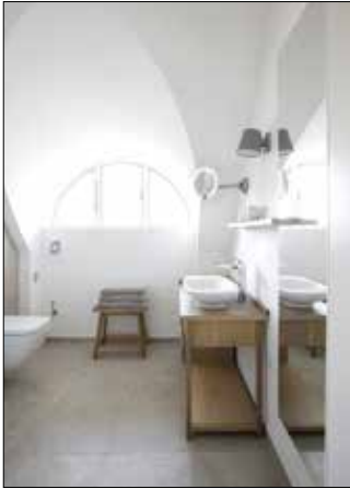
„Ideal im Badezimmer: Hochwertiger Naturkalk verfügt über enorme Speicherkapazitäten. Er kann auf einer Wandfläche von 100 Quadratmetern bis zu 60 Liter Wasser binden.“

Luftfeuchtigkeit von 75 Prozent oder auch etwa 1,5 Liter Wasser. „Heruntergeregelte Raumtemperaturen haben zur Folge, dass