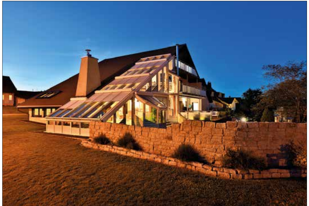
Ohne Rollläden geht im Winter durch die großen Glasflächen viel Wärmeenergie verloren.

müssen. „Die Transmissionswärmeverluste müssen gemäß der geltenden EnEV durch den Einsatz optimierter Baustoffe und Bauelemente begrenzt werden“, so Schanz. Denn durch die großen Glasflächen geht im Winter – selbst beim Einsatz von hochwertigem Isolierglas – viel Wärmeenergie verloren. „Hochwertige Aluminium-Rollläden leisten einen wichtigen Beitrag zur Energieeinsparung“, macht Schanz deutlich. Möglich macht es die dämmende Luftschicht, die sich zwischen der Scheibe und dem Rollladen befindet. Je nach Qualität der verwendeten Verglasung lassen sich mit passgenauen Rollläden bis zu 80 Prozent der Wärmeverluste verhindern. Die Aluminium-Rollläden gibt es für alle horizontalen, asymmetrischen und symmetrischen Wintergärten und Glasflächen. Auch ein nachträglicher Einbau an bestehenden Wintergärten ist ohne Probleme möglich. Mehr Informationen unter www.rollladen.de .