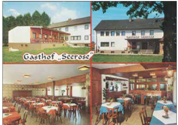
Die Seerose vor vielen Jahren