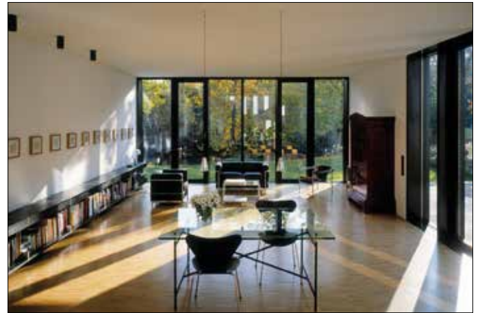
Offene Bauweise bei stabiler Statik: Massive Unipor-Mauerziegel ermöglichen dank ihrer hohen Festigkeit flexible Wandlösungen und breite Durchgänge.

Verfügt das Haus über mehrere Etagen, ist häufig ein Aufzug oder ein Treppenlift von Nöten. Bei Treppenaufgängen sind niedrige Stufen und Handläufe auf beiden Seiten zu berücksichtigen. Auch hier profitieren Bewohner von der Stabilität massiver Mauerziegel. „Bohrungen für entsprechende Halterungen oder Griffe lassen sich bei Ziegeln problemlos vornehmen“, erklärt Fehlhaber. Diese werden auch oft im Badezimmer nachgerüstet – einer der häufigsten Räume für individuelle Anpassungen. Die freie Nutzfläche sollte hier immer mindestens 3,6