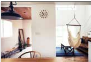
Der ökologische Putz aus den Schweizer Alpen sorgt auch in japanischen Wohnhäusern für ein gesundes Raumklima.

Zu den Interessenten im Land des Lächelns gehören seit Jahren Architekten, die sich auf den