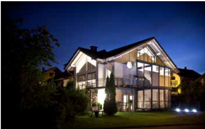
Aluminium-Rollläden gibt es passend für alle Fensterformen und Dachneigungen.

(pr-jaeger) Wintergartenbesitzer können den ungestörten Blick in die Natur auch in der kalten Jahreszeit genießen. Aber nicht jeder Wintergarten ist ganzjährig nutzbar. Unterschieden wird zwischen Kalt-Wintergärten, die im Winter nicht beheizt werden und Warm-Wintergärten, die das ganze Jahr über bewohnbar sind. Ein Kalt-Wintergarten ist in der Anschaffung günstiger, da er kaum bis gar nicht isoliert ist und über keine Heizung verfügt. Der Warm-Wintergarten, auch Wohnwintergarten genannt, bietet dagegen das ganze Jahr über behagliche Temperaturen. Damit werden besondere Anforderungen an die Isolierung, Beschattung und Heizung des Glasbaus gestellt. Im Winter sollen Wärmeverluste, u.a. durch hochwertige