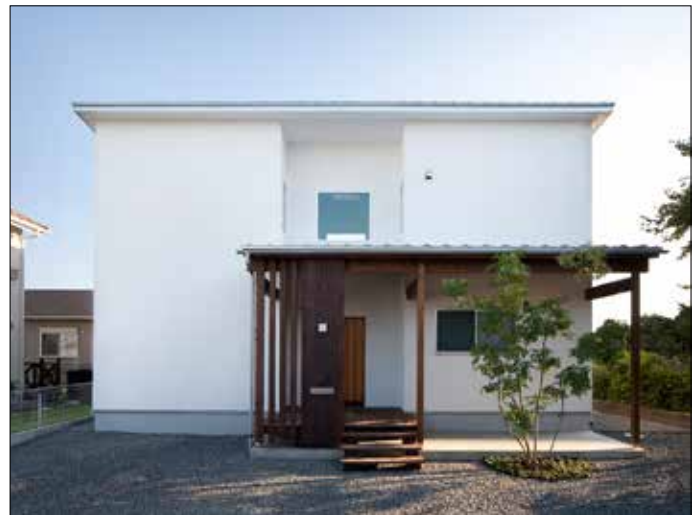
Der diffusionsoffene Edelputz sorgt auch an Fassaden für ein hervorragendes Feuchtigkeitsmanagement und ist schmutzabweisend.